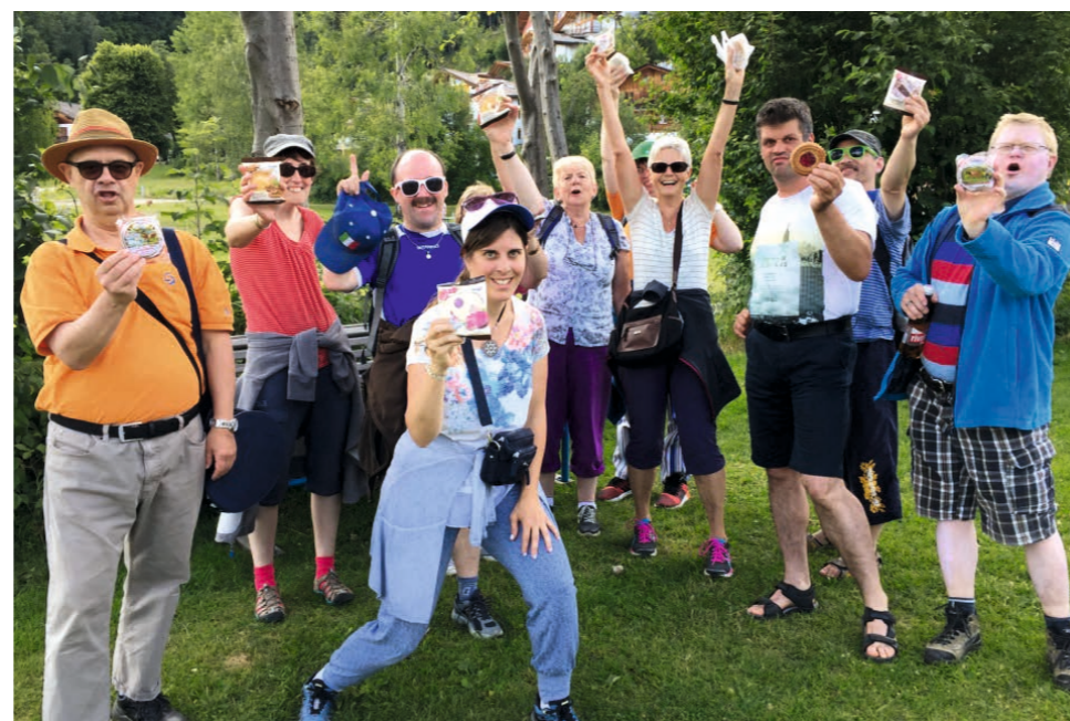
Ferien „Dolce-Vita“ macht Freude und schenkt genussvolle Momente