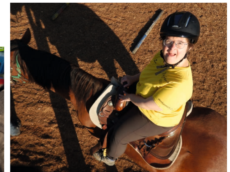
Unvergessliche Augenblicke aus acht Ferientagen im Emmental