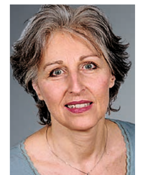
Lotti Leu Fundraising bis Mai 2018