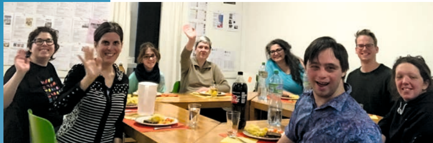
Kurs «Mitsprache» Wir reden jetzt mit.

Was Veränderung für unsere Mitglieder bedeutet, lesen Sie in den folgenden Interviews.