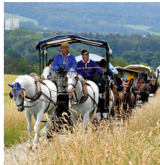
Ausflug „Rösslifahrt“, gemeinsam die Natur erleben.

Nehmt das Schicksal in eure eigenen Hände und macht das Beste daraus.