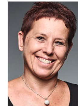
Beatrix Denicola Kurse Anlässe Ferien